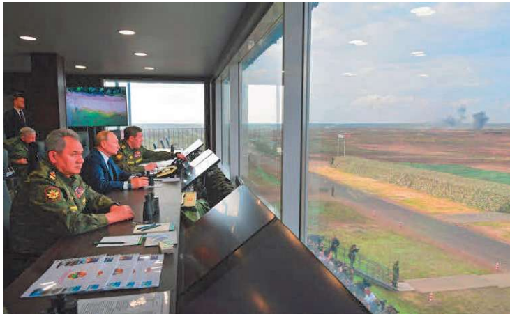
Venemaa president ja Relvajõudude ülemjuhataja Vladimir Putin vaatlemas läbi klaasi õppust „Zapad 2021“. Kaaslasteks kaitseminister Sergei Šoigu ja Kindralstaabi ülem Valeri Gerassimov.