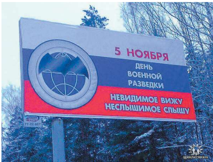
Venemaal pildistatud plakat 5. novembri – Venemaa sõjaväeluure aastapäeva tähistamiseks. Ehkki plakatil väidab GRU, et näeb nähtamatut ja kuuleb kuuldamatut, ei ole ta oma tegevuse varjamisel kaugeltki nii osav.